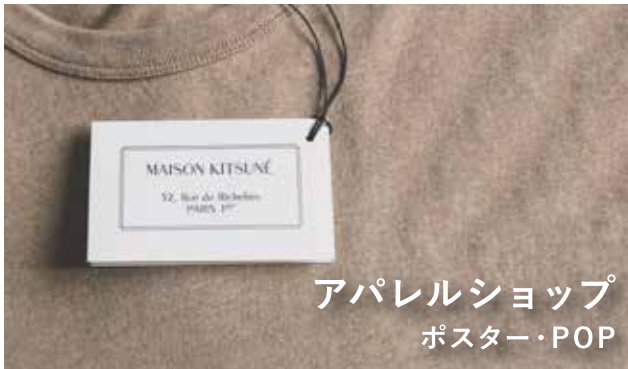
アパレルショップ ポスター・POP