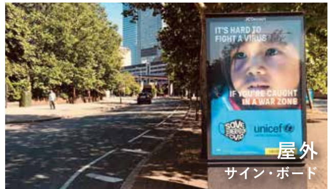
屋外 サイン・ボード