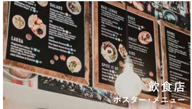
飲食店 ポスター・メニュー