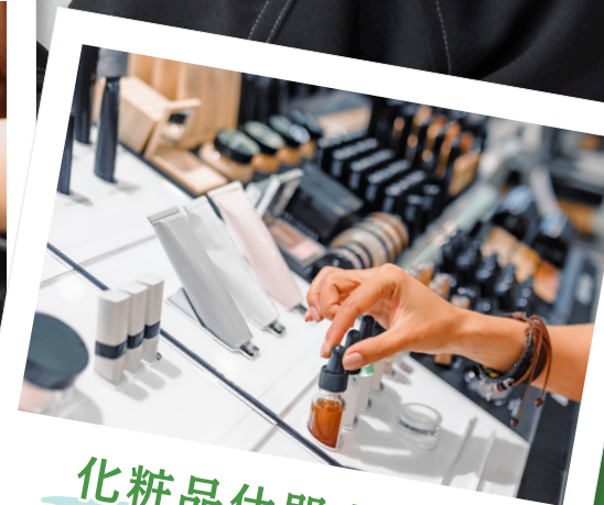
化粧品什器カバー